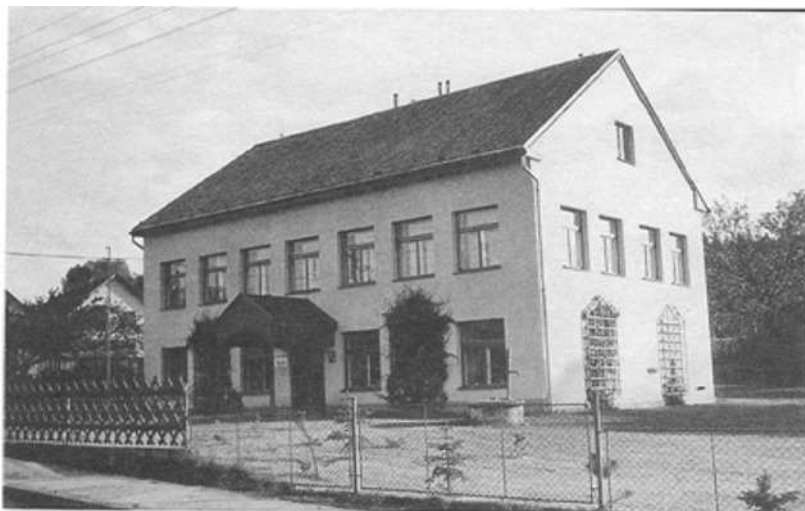
V r. 1833 začalo vyučování v Kostecké Lhotě v soukromých prostorách. Přestavbou sýpky velkostatku v r. 1836 vznikla nynější budova školy. V r. 1980 bylo vyučování zrušeno a nový provoz školy obnoven v r. 1992. Pravidelná výuka v této budově byla ukončena ve školním roce 2006/2007. I nadále je jedním z pracovišť Základní školy v Kostelci nad Orlicí.