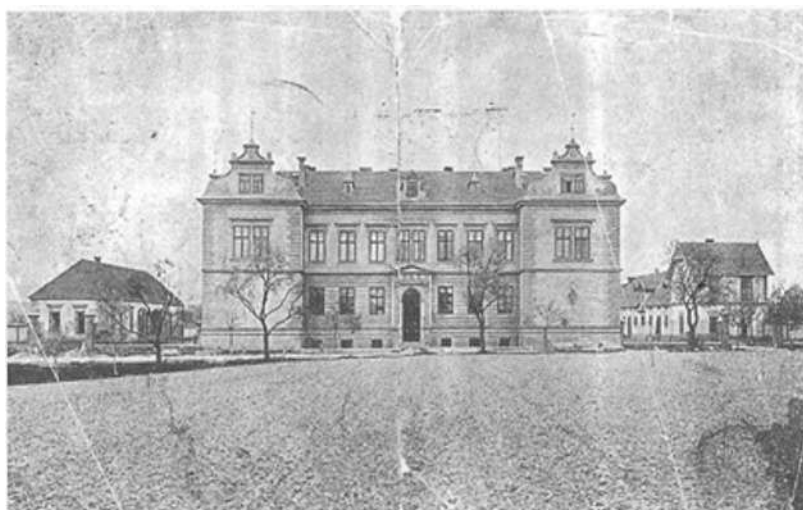
Na zasedání městské rady dne 22. 11. 1894 bylo rozhodnuto o zřízení rolnické školy na návrh Hospodářsko - průmyslové jednoty v Kostelci nad Orlicí. Výuka v tehdejší nové budově byla zahájena v r. 1897.