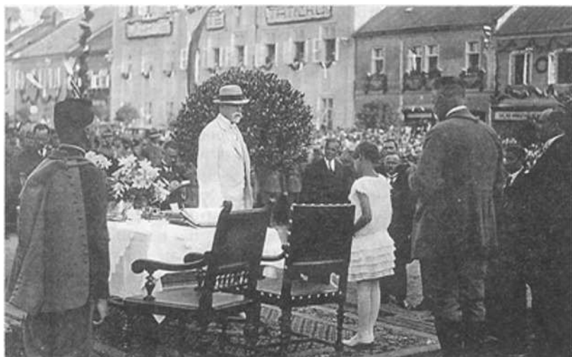
Návštěvy presidenta první Československé republiky T. G. Masaryka v r. 1926 a 1929 předznamenaly pojmenování škol: Masarykova škola práce a Masarykovo reálné gymnasium.