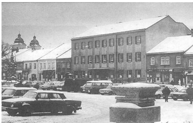
V r. 1875 byl přestavěn obecní dům na náměstí /č. 45 a 46/ na chlapeckou školu obecnou a měšťanskou, za finanční úhrady obce 36 000 zlatých. Dalšími přestavbami a přístavbami měnila svoji tvář a názvy.