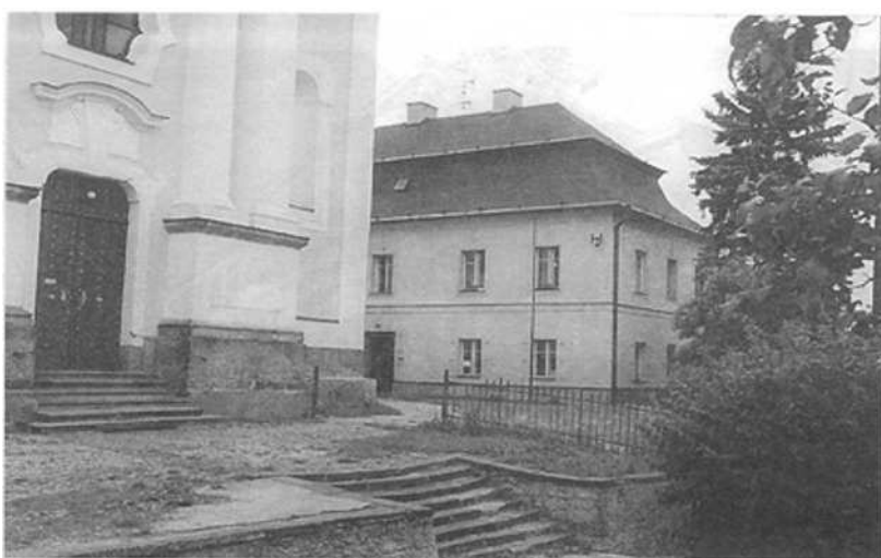
První školní budova nového věku z konce 18. stol.. Později dívčí škola, nyní Klub důchodců.