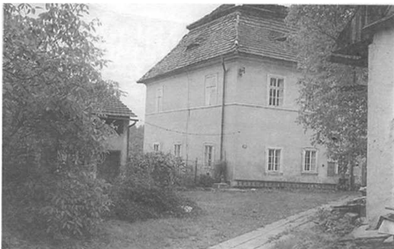
Místo patrně nejstarší školy v Kostelci nad Orlicí při děkanství, vedle bývalé konírny a chléva.