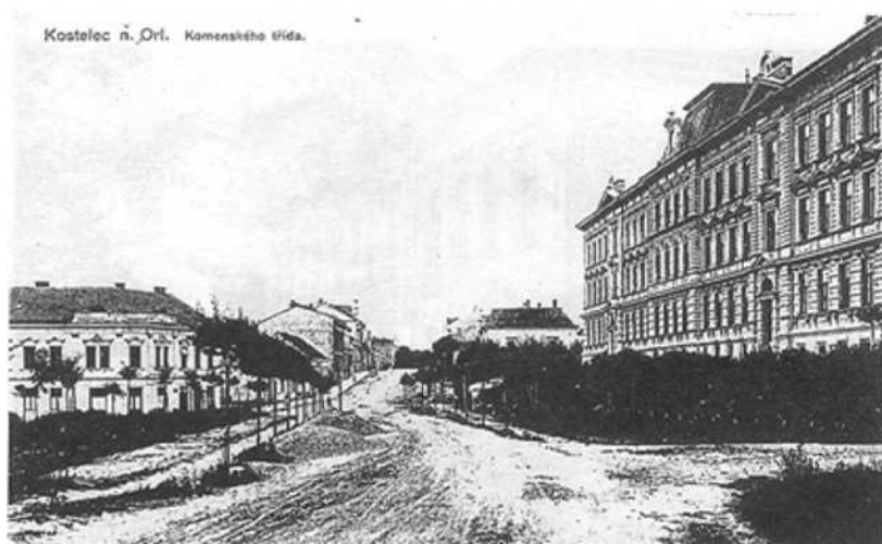
Budova Obchodní akademie TGM - původně reálky - postavena podle plánů arch. Vrat. Pasovského v polovině 90. let devatenáctého století. Otevřena byla 19. září 1897.