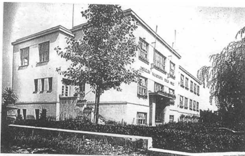
Pokračovací učňovská škola existovala v našem městě již r. 1892. V r.1931 byla uvedena do provozu moderní učňovská škola, která nesla název: Masarykova škola práce.